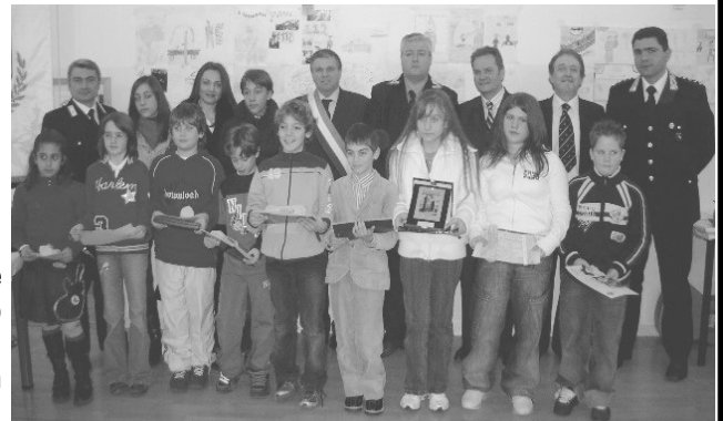
Alunni premiati e Autorità il 18 febbraio 2006

La premiazione è avvenuta al termine della Santa Messa (ornata dalle musiche e dai canti dei "Cantori del Plettro"), celebrata dal cappellano militare alla presenza delle autorità civili e militari e di un folto gruppo di cittadini. Nel cortile della scuola, prima della celebrazione, era atterrato un elicottero dei Carabinieri in omaggio alla memoria di Daliso.